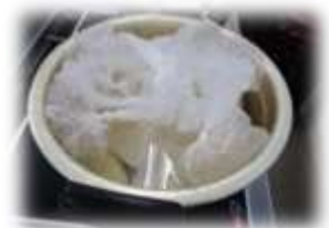
スパゲッティを茹でています。

2023年9月1日は、関東大震災から100年の節目になります。今一度防災について、大人も子どももそれぞれの立場で考えてみてはいかがでしょうか。