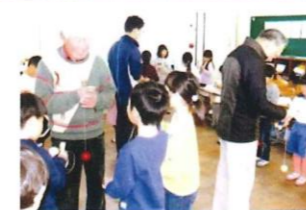
けん玉を楽しんでいます

老上小学校1年生児童に昔遊びを教え、同時に高齢者との交流行事、令和元年度は12月と年明けて1月に行いました。遊びは8種目、まりつき、お手玉、おはじき、けん玉、コマ回し、めんこ、あやとり、ゴム飛び、子どもたちも高齢者もそれぞれに分かれて楽しいひとときを過ごします。褒めてもらったときの子らの喜びの表情は、いつまでもいつまでも……です。