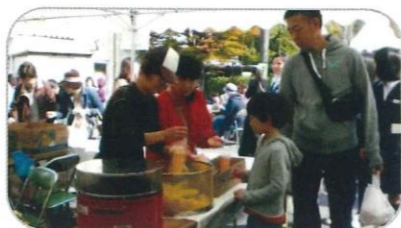
ふれあい老上まつり模擬店(ポップコーン)

いろいろな活動を行っています。春は草津川三角公園で行われる桜まつりに参加、夏は琵琶湖矢橋帰帆島付近清掃、秋は市社協ボランティアまつりの教養大学講座受付協力、その他各種団体の研修に参加させて頂いております。ふれあい老上まつりにも毎年参加し、私達も楽しみにしております。今後、いろいろな行事に参加し、活動していきたいと思っております。