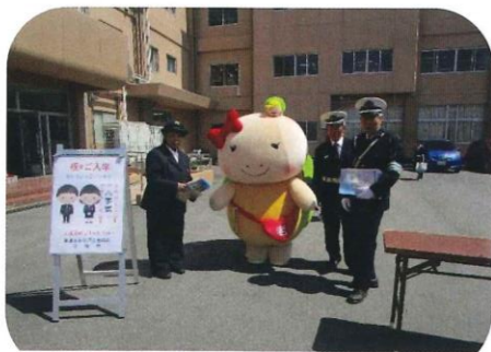
老上中学校入学式交通安全啓発活動

この3、4年は子どもと一緒に毎日学校まで歩いています。通学路が狭く、さらに最近住宅が多く