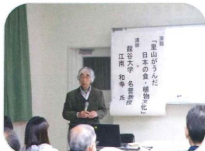
今年の教育振興会 里山講演会

教育振興会は、市助成金補填のため昭和40年に発足し、住民の寄付金を施設充実等のため小学校に納めておりました。途中、会費600円/戸の頃に中学校にも配分し、設備充実費は高額なものまで多岐にわたっていました。平成25年以降は、学校・園の設備も充実し、会費を減額、設備費を外し研修補助費及び飼育・栽培費として配分しております。また、会員及び関係者との親睦、研修を図り、年1回の講演会を開催しております。