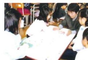
おはじきを教えてもらっています