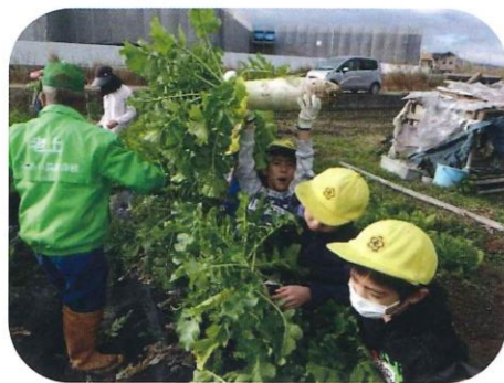
老上小学校農業体験

平成12年に老上ふれあい農業合校がスタートして20年目を迎えました。学校週5日制になった年でした。「子どもたちが家庭や地域で生活する時間を、農業体験してもらおうといいですね」という地域の皆さんの思いで発足しました。いじめや、青少年の問題行動が起きている中、農業を行っている方も少子高齢化で休耕田が増加してきている環境にありました。