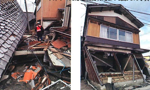
←草津市応急危険度判定士撮影