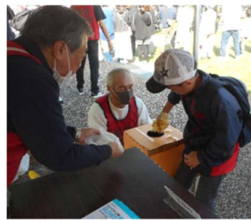
パインあめ掴み取り