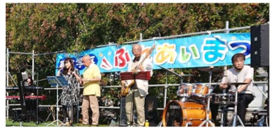
草津プレイボーズ