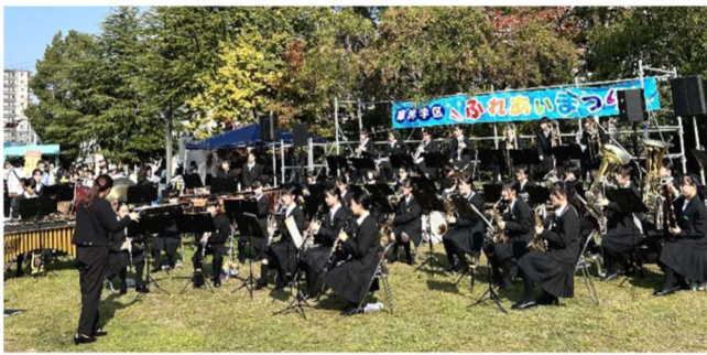
草津中学校吹奏楽部

お天気に恵まれ、草津中学校吹奏楽部のファンファーレで、ふれあいまつりがスタートしました。各町内会・各種団体・地域の方々のご協力のもと、2000人を上回る地域住民の方々にご来場をいただき、楽しい時間を過ごしていただけたと思っております。ありがとうございました。