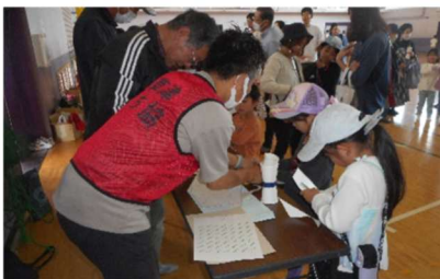
科学実験コーナー