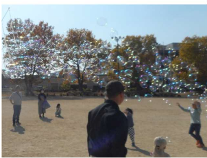
大きなシャボン玉を作ろう