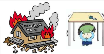
災害時防災資機材展示