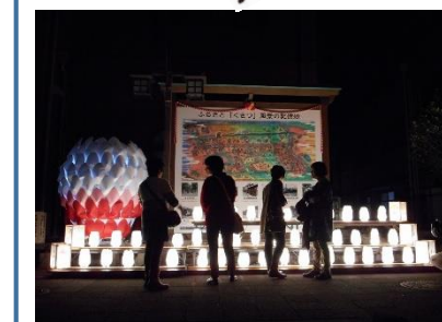
街あかり・華あかり・夢あかり2015