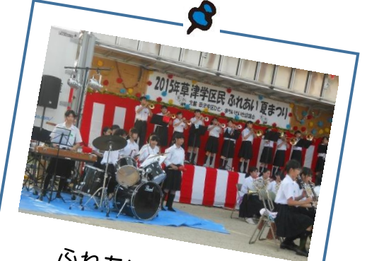
ふれあい夏まつり