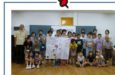
公民館の家 体験合校 8月2日～3日