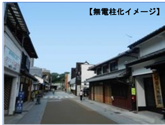
【無電柱化イメージ】