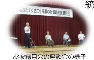
お披露目会の座談会の様子

この土地の良いところ、ここにしかない、ここにあるものを数多く探し出してその価値を見つけ出し、生かす努力をすれば、まちづくりの道は自ずと開けると信じています。