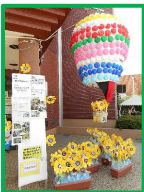
今年の題名「大空に向かって」

8月23日(日)に開催された「つくりものコンクール」に参加し、佳作を受賞しました。「大空に向かって」大きな気球と黄色鮮やかなひまわりが咲き誇っていました。