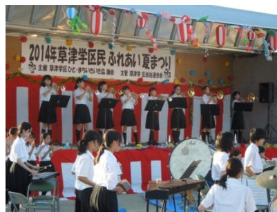
草津中吹奏楽部演奏

「草津学区ふれあい夏まつり」を七月二十六日に開催しました。会場には各町内会、各種団体による出店がずらりと並び、来場者の列ができました。祭りの最後には毎年恒例の大抽選会が開かれ、豪華商品を狙う大勢の人で盛り上がりました。