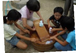
宿場町草津の歴史も学びました