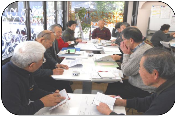
草津学区の委員会の様子