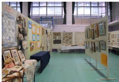
公民館の自主サークルの作品