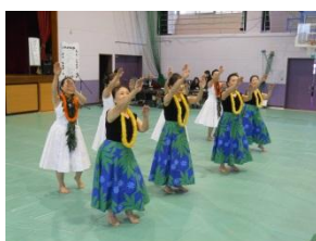
公民館の自主サークルによる発表