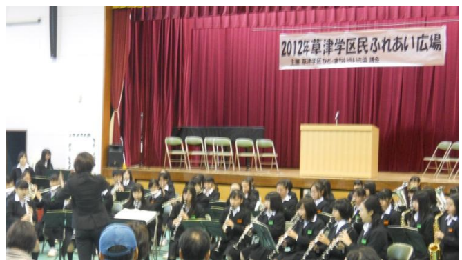
草津中学校吹奏楽部のオープニング演奏

ステージ発表では、公民館の自主サークルの皆様による歌やダンス、マジックなどが披露され、日ごろの練習の成果を十分に発揮されていました。また、作品展示では、絵画や能面、手芸、書など素晴らしい力作で目を楽しませていただきました。