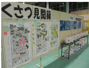
地域協働学校の作品

残念ながら、雨のためグランドゴルフや車椅子体験などの一部の催しは中止となりましたが、恒例になりました福祉バザーは、多数の方にお越しいただき、盛況のうち、終了させていただきました。出品ならびに来場いただきました皆様、ご協力いただき大変ありがとうございました。