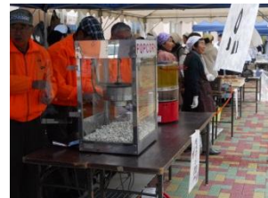
模擬店とバザーも盛況でした。