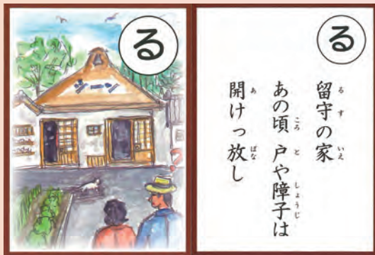
＝かるた絵は 良き時代からの 訪問者（番外）＝

地域コミュニティの原点をお聞きしたような気がしました。しかし、最近は闇バイトなど犯罪者をネットで募集するようなそんな時代になり、防犯・戸締りには用心が必要と思います。