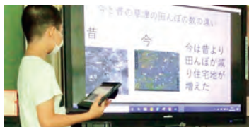
分かったこと、見つけたことをプレゼン