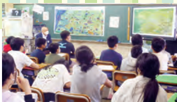
昔の生活をふるさと記憶絵で

一回目は、学習の様子です。グループに分かれて、「昔の笠縫小学校」や「昔の商業」、「昔の生活・あそび」や「民俗芸能のサンヤレ踊り」などを調べています。この学習ではフィールドワークとして、地域に出かけ住民の方からいろいろ説明を受けたり、講師として学校に招いたりしています。そして、自分たちが発見した事は、他のグループにプレゼンして内容の共有を行っています。児童たちが発見した笠縫を、次号のリーフかさぬいで紹介します。