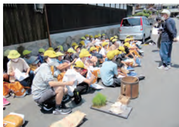
昔の水路を下笠で現地調査