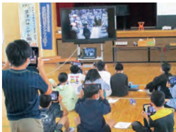
サンヤレ踊りを知る