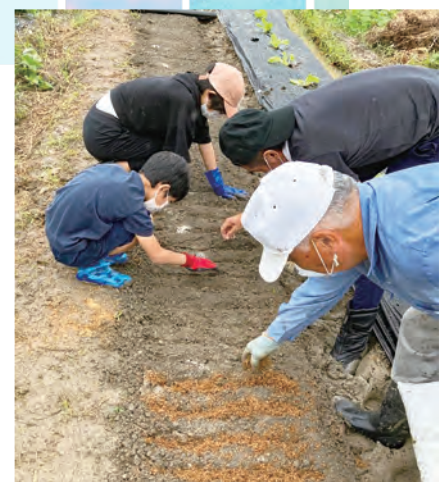
ほうれん草の種まき