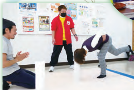
からだ年齢チェック

3年ぶりの開催となった「かさぬい健康フェスタ」は、2時間余り で約130名の参加者で賑わいました。