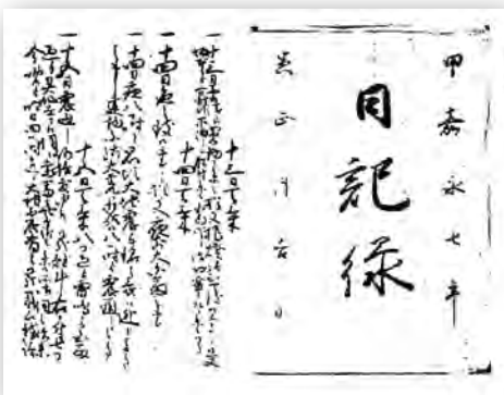
地震の記事が見える 「小森家日記」